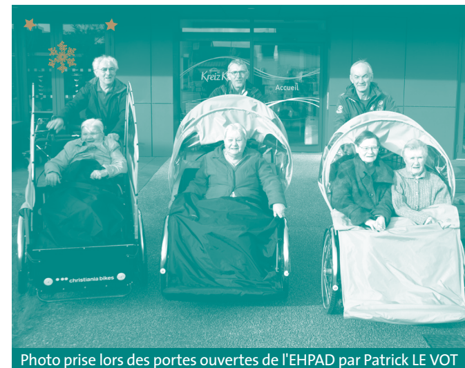
Photo prise lors des portes ouvertes de l'EHPAD

Après une journée « portes ouvertes » particulièrement réussie grâce à la participation des équipes, des résidents et de tous les partenaires, l'EHPAD se mobilise maintenant sur un autre projet, l'organisation d'un « Noël coloré à la Résidence du Kreizker ». Au menu : la décoration extérieure de l'établissement avec l'aide des enfants des écoles, des lectures de contes de Noël, l'organisation d'un goûter de Noël intergénérationnel, une distribution de chocolats et de la danse latine, sans oublier bien sûr la venue du Père Noël et peut-être d'autres surprises ! Il n'y a guère de doute : avec un menu aussi copieux, « l'ambiance conviviale et festive » espérée par les organisateurs sera bien au rendez-vous ! Ce beau projet a attiré l'attention du jury de la Fondation de France qui a décidé, dans le cadre de son appel à projet 2022, « Réveillons